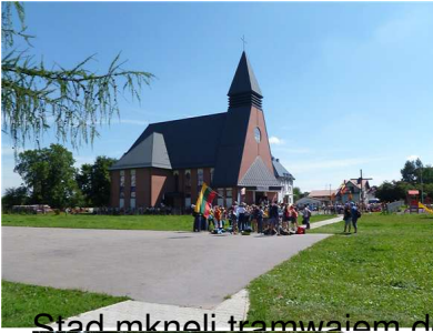
Stad mknęli tramwajem do centrum z wiarą - na modlitwę i z entuzjazmem - na zabawę.

Wpisany przez Zbigniew Dranka wtorek, 13 września 2016 10:55